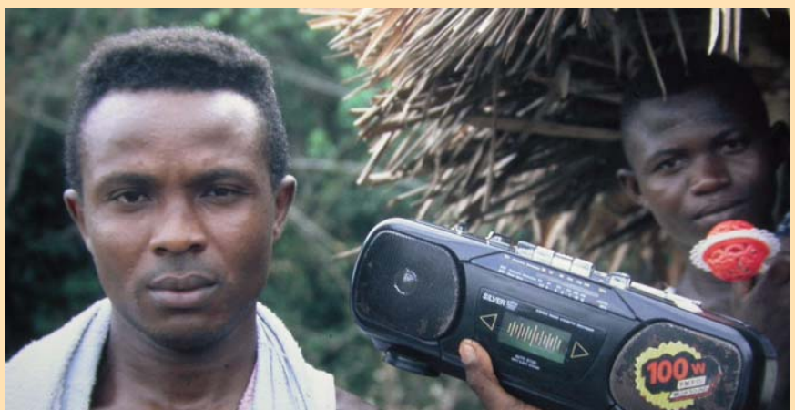
Für Flüchtlinge sind verlässliche Nachrichten aus der Heimat so wichtig, wie sauberes Wasser oder medizinische Versorgung.