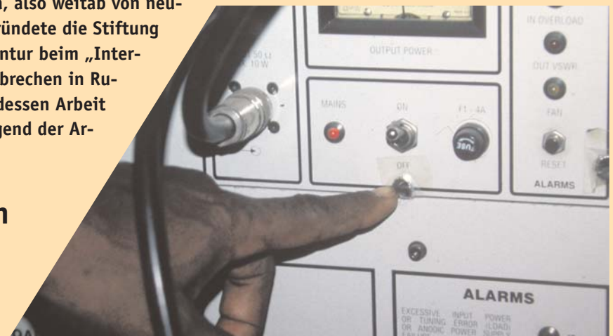
Menschen und Technik in Afrika müssen einiges aushalten: Auf diesen Sender hat ein Soldat seine AK47 abgefeuert.